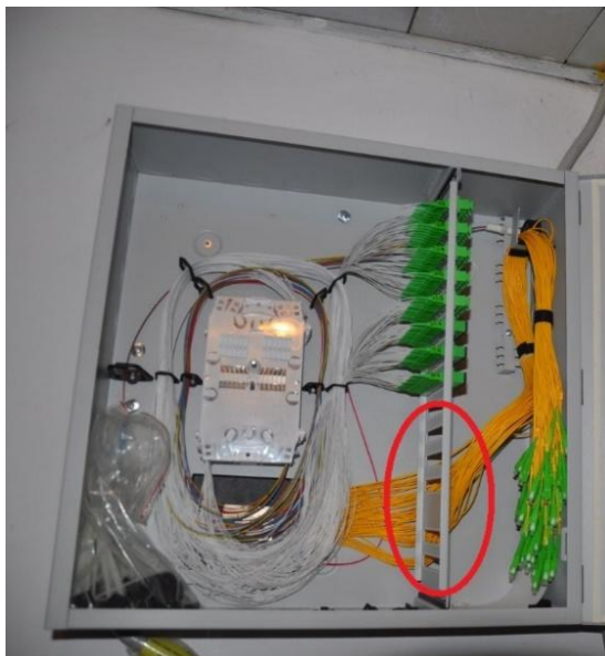
Rys.1. Wolne pola na ODF mogące pełnić funkcję pól parkingowych dla wtyków multipaczki PT